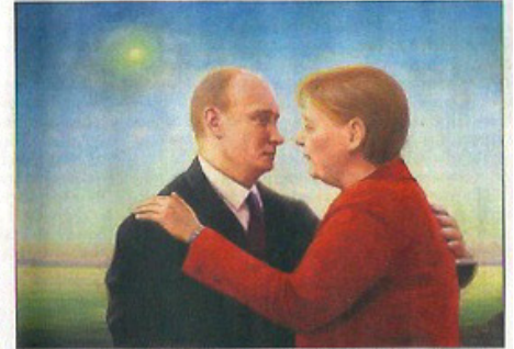
Liebensraum, öljy levyille, 2014.