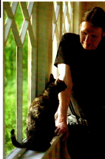
Nova-kissa on tärkeä perheenjäsen.