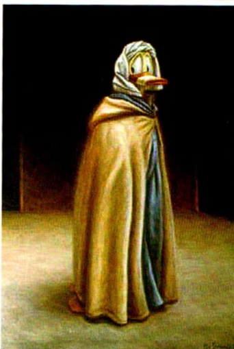
▲ Aivan ensimmäinen ankkataulu on nimeltään Ei viestiä . Se syntyi 1989.